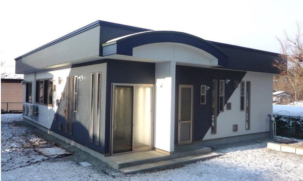
H28. 12 竣工 移山寮食品加工場