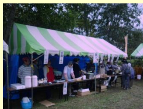
移山寮収穫祭の様子