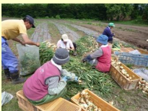
農産物（玉ねぎ収穫）