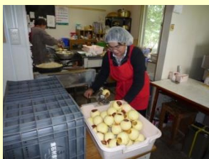
加工（りんごの皮むき）