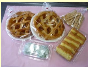
加工（アップルパイなど）