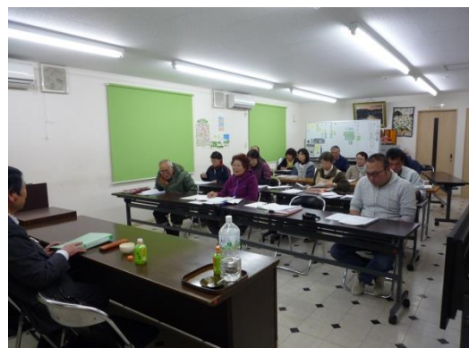
H30.3月 キャリアパス制度研修会