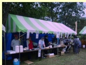
移山寮収穫祭の様子