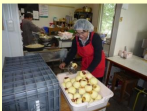
加工（りんごの皮むき）