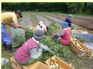
農産物（玉ねぎ収穫）