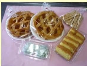
加工（アップルパイなど）